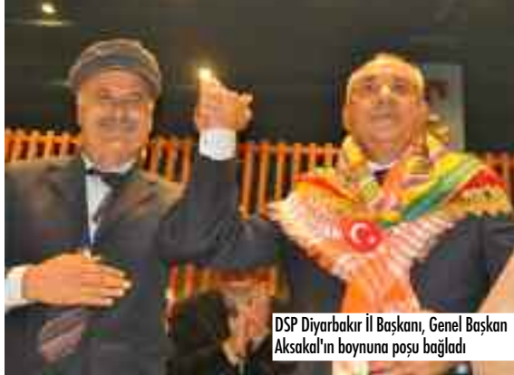
DSP Diyarbakır İl Başkanı, Genel Başkan Aksakal'ın boynuna poşu bağladı.