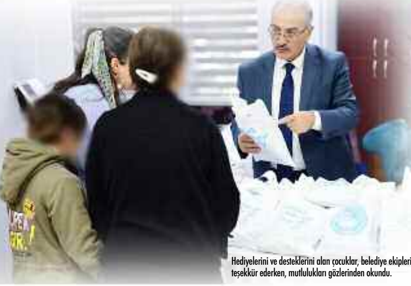
Hediyelerini ve desteklerini alan çocuklar, belediye ekiplerine teşekkür ederken, mutlulukları gözlerinden okundu.

Kestel Belediyesi 'Eller de, yürekler de üşümesin' projesi kapsamında ilçedeki ihtiyaç sahibi çocuklara atkı, bere, eldiven ve çorap hediye etti. Başkan Önder Tanır, "Mutluluk sevincimizi artırıyor" dedi.