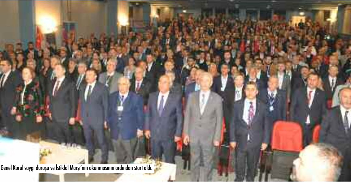
Genel Kurul saygı duruşu ve İstiklal Marşı'nın okunmasının ardından start aldı.