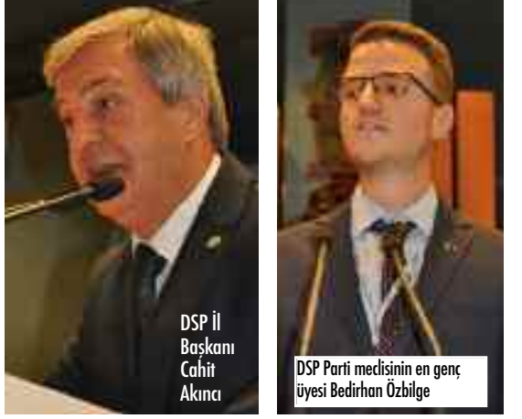
DSP İl Başkanı Cahit Akıncı