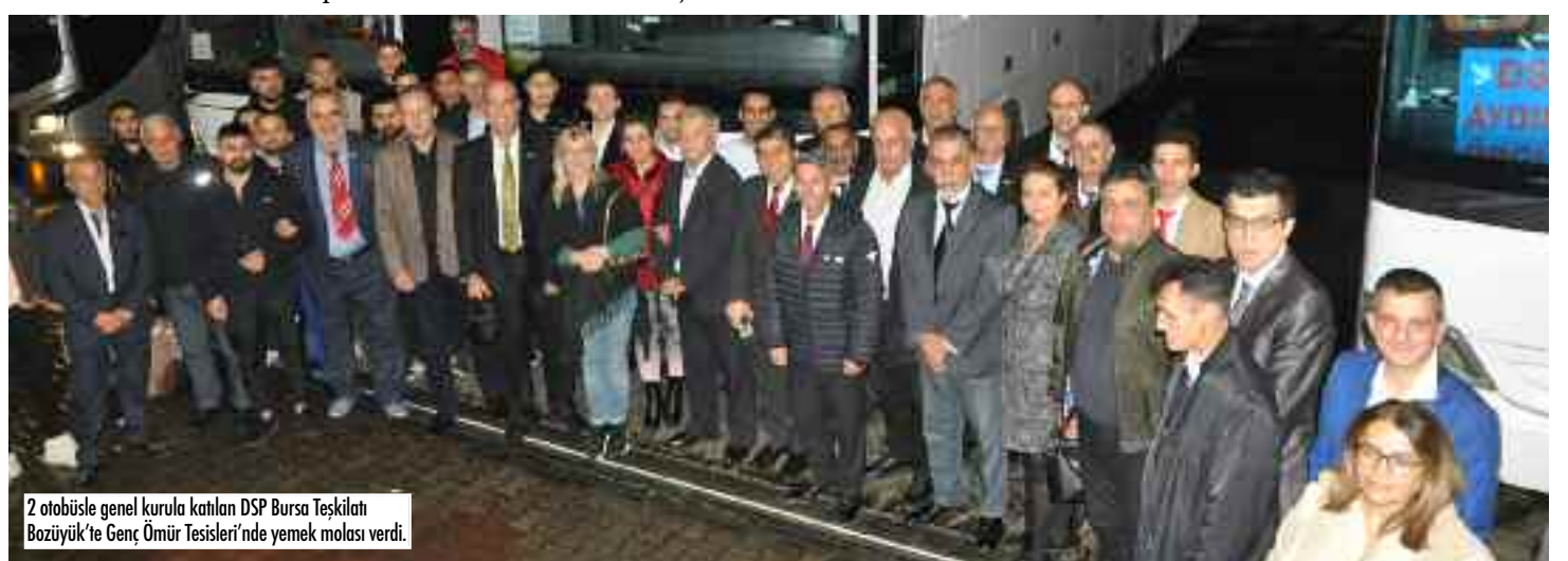
2 otobüsle genel kurula katılan DSP Bursa Teşkilat Boziyüğü'ne Genç Ömür Tesisleri'nde yemek molası verdi.