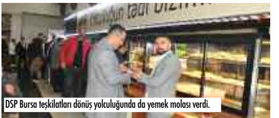
DSP Bursa teşkilatları dönüş yolculuđunda da yemek molası verdi.