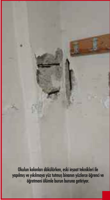
Okulun kolanları dökülürken, eski inşaat teknikleri ile yapılmış ve yıkılmaya yüz tutmuş binanın yüzlerce öğrenci ve öğretmeni ölümlerine burun buruna getiriyor.