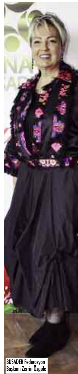
BUSADER Federasyon Başkanı Zerrin Özgüle