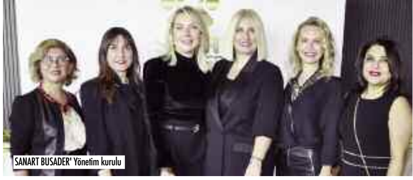
SANART BUSADER' Yönetim Kurulu