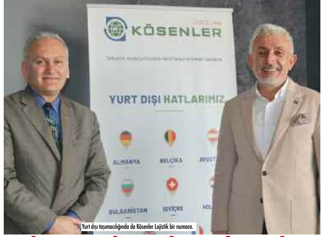
Yurt dışı taşımacılığında Kösenler Lojistik bir numara.

Sektördeki durumumuz bu. Ben hakikaten kendime de firmama da personelime de güveniyorum. Biz istemezsek o firma bizden ayrılmaz. Ne isterlerse sonuçta hepsini en güzel şekilde yapabiliyoruz. Çünkü uluslararası çok başarılılarımız da var bizim. Uzun yıllar beyaz et sektöründe taşımacılık yaptık, mikro dağıtım ağına kadar çalışmamız var. Özel butik tarzı çalışmaları çok iyi becerebiliyoruz, proje firmasıyız yani. Firma diyecek ki bizim şu ürünümüz var bu ürünün ben minimum maliyette, maksimum verimle taşımak istiyorum, hızlı taşımak istiyorum. Tüm bunları kurabilecek etkinliğimiz var bu bilgi donanımımız bizim Müşterilerimizle sürekliliğimizi garanti altına alıyor.