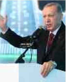
Erdoğan, "Çukurova Havalimanı'nı önümüzdeki ay açmayı hedefliyoruz" dedi.

■ Terörle ülke siyasetinin şekillendirildiği eski Türkiye'nin artık geride kaldığını ifade eden Cumhurbaşkanı Erdoğan, "Terör saldırılarıyla milletimizi bölme planlarının raf ömrü tükenmiştir. 85 milyonun kardeşliğine kastedilemesine aramızda nifak sokulmasına kesinlikle izin vermez" dedi. ■ 7'DE