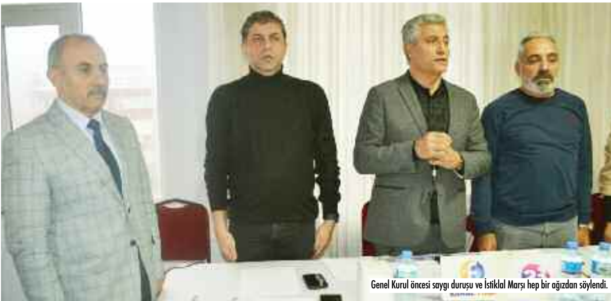
Genel Kurul öncesi saygı duruşu ve İstiklal Marşı hep bir ağızdan söylendi.