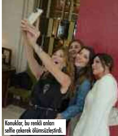
Konuklar, bu renkli anları selfie çekerek ölümsüzleştirdi.