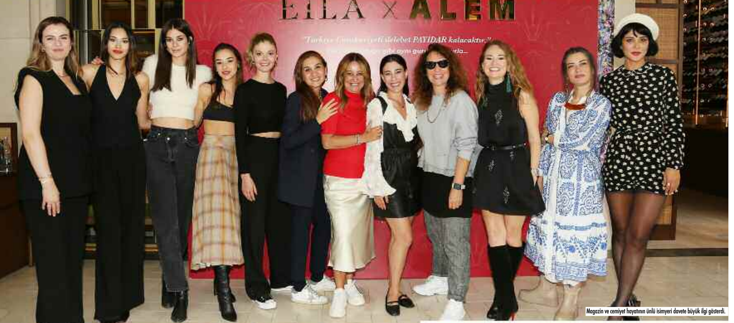
Magazin ve cemiyet hayatının ünlü isimleri davete büyük ilgi gösterdi.