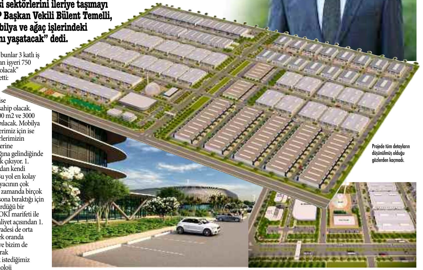
Projede tüm detayların düşünülmüş olduğu gözlerden kaçmadı.