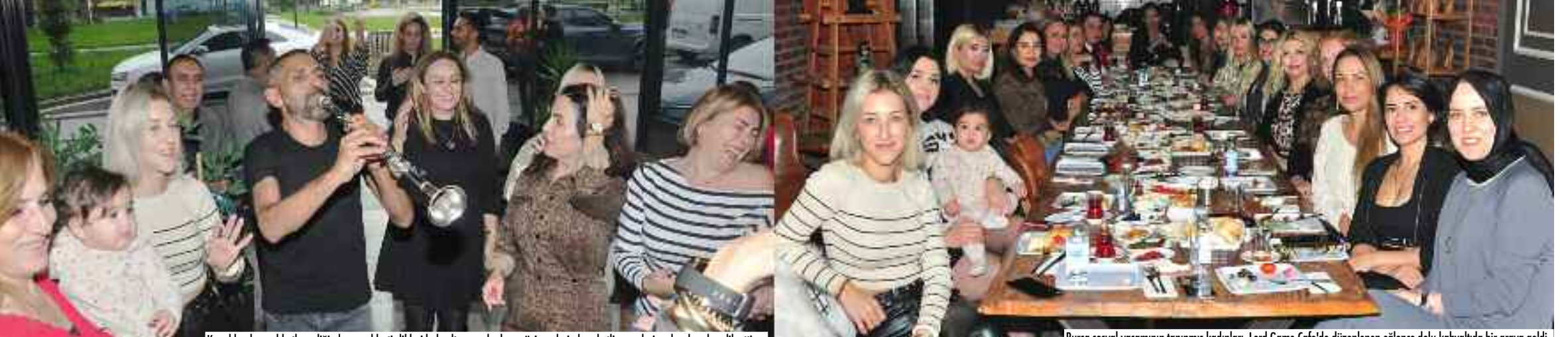
Konuklar, hoş sohbetler eşliğinde gerçekleştirdikleri kahvaltının ardından müzisyenlerin hareketli namelerine danslarıyla eşlik etti.