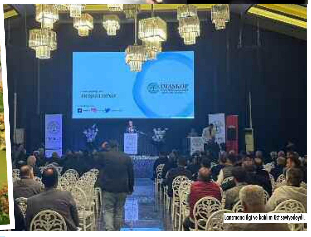
Lansmana ilgi ve katılım üst seviyeydi.