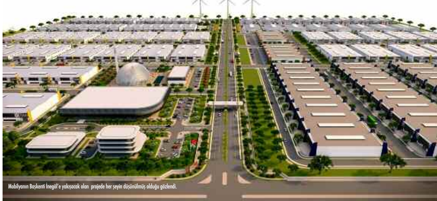
Mobilyanın Başkenti İnegöl'e yakışacak olan projede her şeyin düşünülmüş olduğu gözlemlendi.

İnegöl Mobilya Ağaç İşleri Küçük Sanayi Sitesi Yapı Kooperatifi (İMASKOP), İnegöl'ün mobilya, ağaç işleri ve mobilya yan sanayisi sektörlerini ileriye taşımaya hedefleyen önemli bir projenin lansmanını gerçekleştirdi.