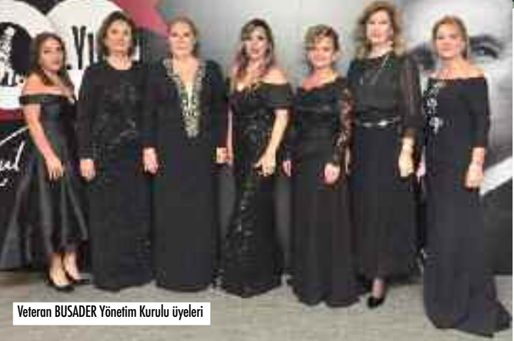
Veteran BUSADER Yönetim Kurulu üyeleri