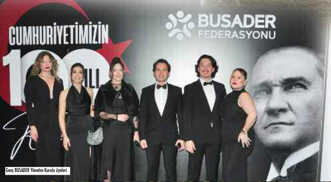
Genç BUSADER Yönetim Kurulu üyeleri

Cumhuriyetimizin 100. yıl kutlamalarını tüm yıla yayan BUSADER Federasyonu, çatısı altında yer alan Veteran BUSADER'in organizasyonu ile görkemli bir baloya imza attı. Yapımı Hatay Samandağ'da süren BUSADER İlkokulu yararına gerçekleşen gecede sahneye çıkan Fatih Erkoç, konuklara eğlence dolu anlar yaşattı.