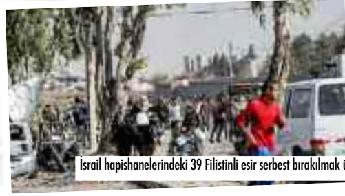
İsrail hapishanelerindeki 39 Filistinli esir serbest bırakılmak üzere Batı Şeria'ya nakledildi.

■ Gazzede dört günlük insani ara ve rehine takası başladı. Gazzeye yardım ve yakıt girişine izin veriliyor. İsrail ordusu Kuzey Gazzeye geçmek isteyenlere ateş açtı. Çok sayıda kişi yaralandı. ■ 7'DE