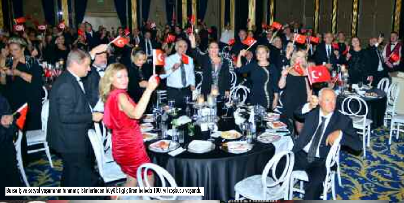
Bursa iş ve sosyal yaşamının tanınmış isimlerinden büyük ilgi gören baloda 100. yıl coşkusu yaşandı.