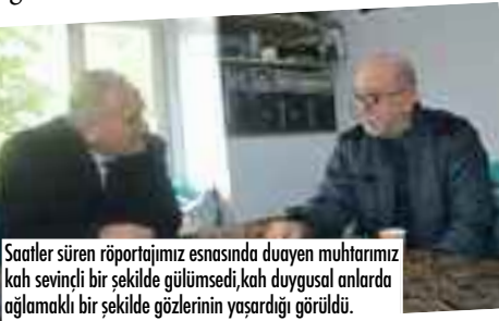
Saatler süren röportajımız esnasında duayen muhtarımız kah sevinçli bir şekilde gülmüş, kah duygusal anlarda ağlamış bir şekilde gözlerinin yaşardığı görülür.