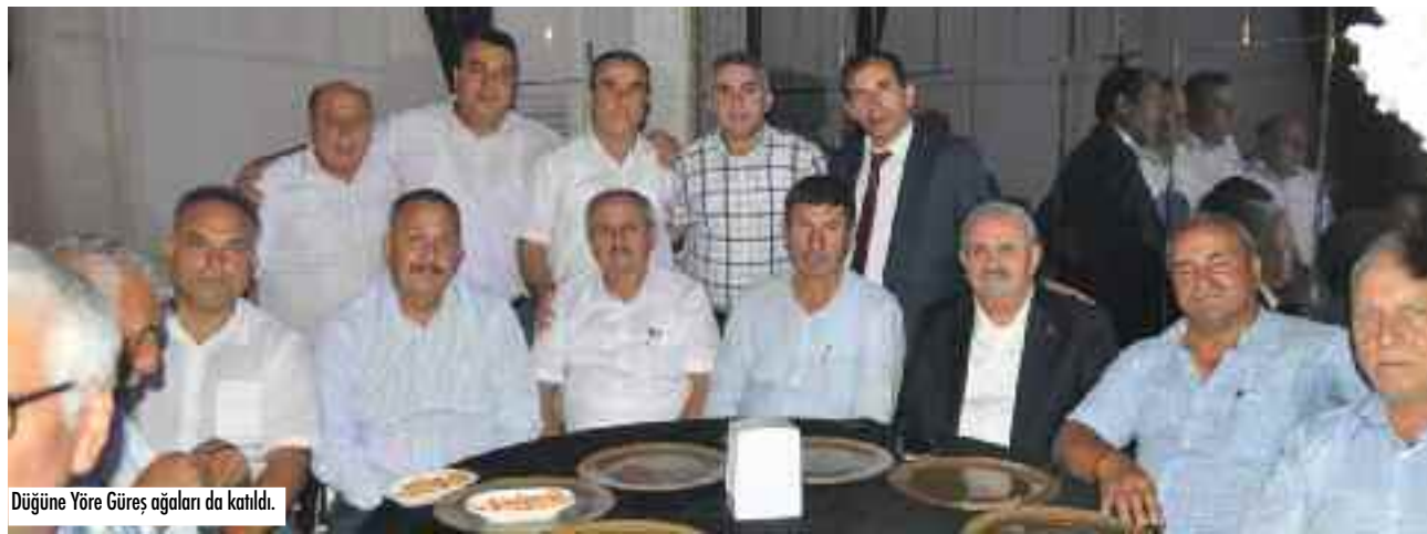
Düğüne Yöre Güreş ağaları da katıldı.