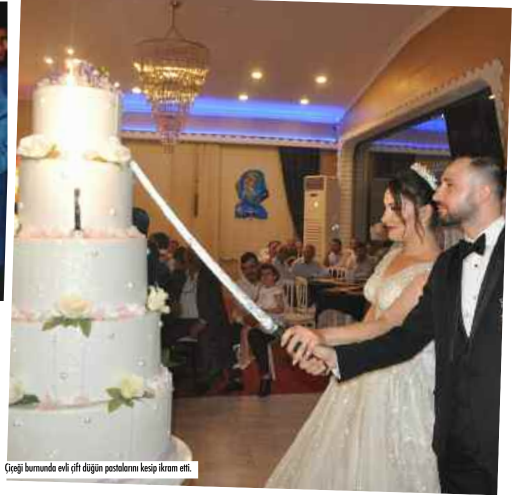
Çiçeği burnunda evli çift düğün pastalarını kesip ikram etti.