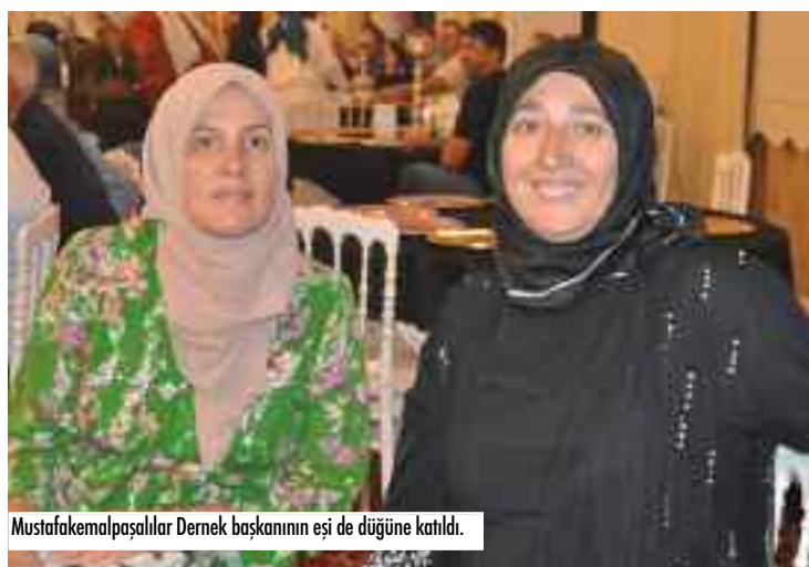
Mustafakemalpaşalılar Dernek başkanının eşi de düğüne katıldı.