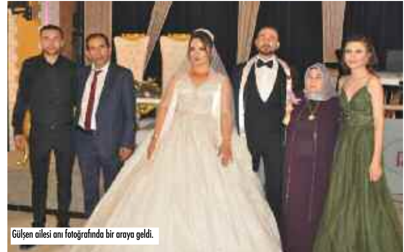
Gülşen ailesi am fotoğrafında bir araya geldi.