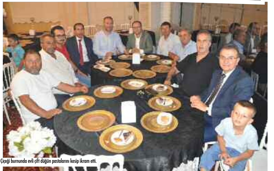
Çiçeği burnunda evli çift düğün pastalarını kesip ikram etti.