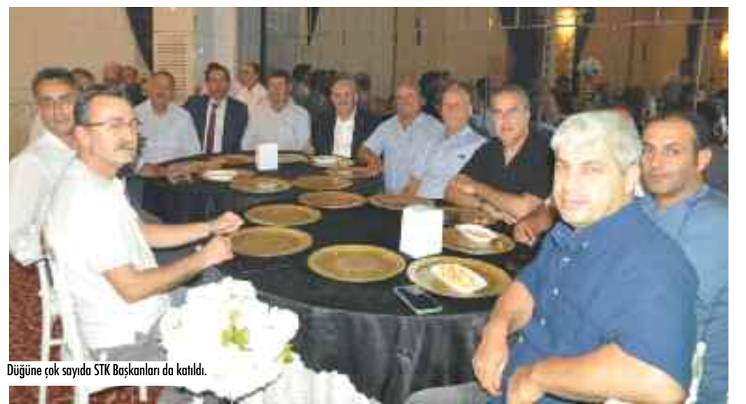
Düğüne çok sayıda STK Başkanları da katıldı.