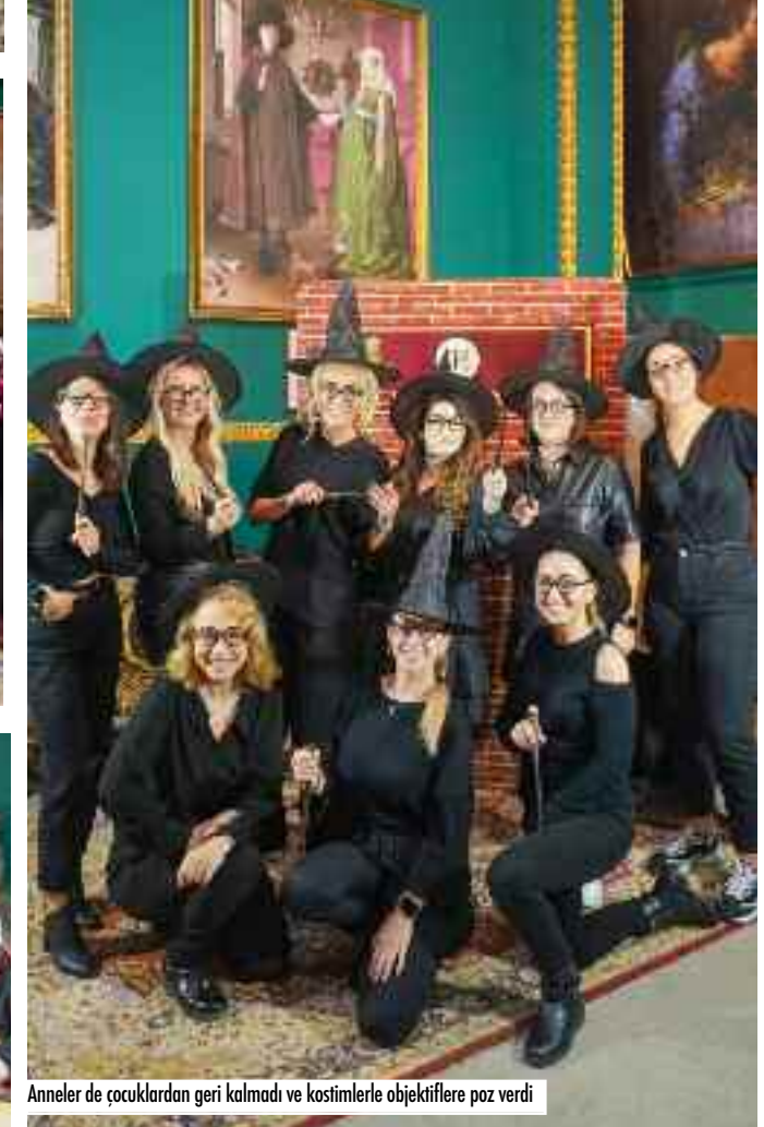
Anneler de çocuklardan geri kalmadı ve kostimlerle objektiflere poz verdi