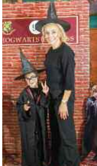
Sudan, Su Şahin