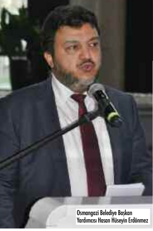
Osmanгази Belediye Başkan Yardımcısı Hasan Hüseyin Erdönmez