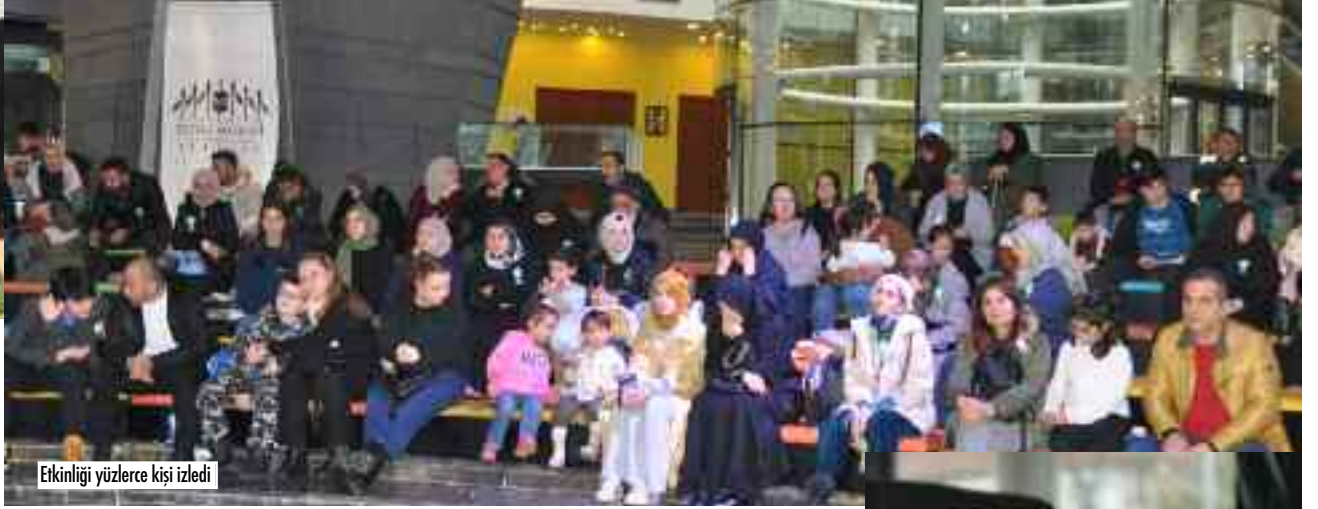
Etkinliği yüzlerce kişi izledi