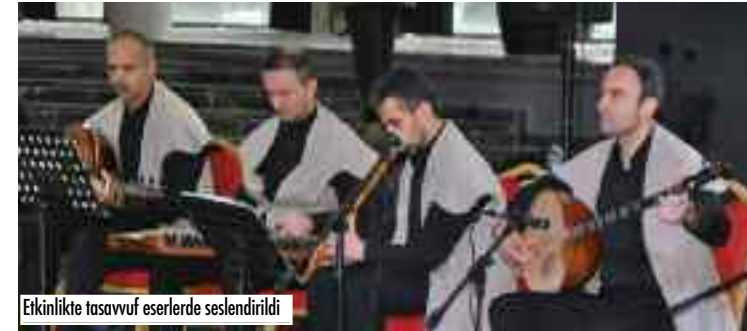
Etkinlikte tasavvuf eserlerinde seslendirildi

Hz. Mevlana'nın her yıl aralık ayının 17'sinde Konya Büyükşehir Belediyesi'nin düzenlediği Şeb-i Arus (DÜĞÜN GECE) başta olmak üzere bir dizi etkinlik ve dualarla anıldığını hatırlatan Başkan Bozkurt, "Biz de Konya'dan gelip de Bursa'da yaşayan ve Konyadaki etkinliklere katılmayan hemşehrilerimiz için Konya'yı buraya getirdik. Üç yıl önce kurduğumuz derneğimizin bir kültür etkinliği olan, Mevlana C ealeddin-i Rumi'nin vefat ettiği gece olan Şeb-i Arus; rabbine ulaşma, vuslat gecesi ya da düğün gecesini kutlamak ve Hz. Mevlana'yı anmak için burada bir araya geldik. Mevlana'nın sevgiliye yükselişi bugün de semazen gösterileri eşliğinde anılmakta, dünyanın dört bir yanından insanlar bu törenlere büyük ilgi göstermektedir. Bizim üç yıl içinde ne yaptığımızı soracak olursanız, Konya, Ankara, İstanbul ve Çanakkale ziyaretlerimiz ile iftar etkinliklerimizi gerçekleştirdik. Bu sene dernek yönetimi olarak Konya ziyareti ile Bursalı ve Konyalı hemşehrileriyle buluşturmaya planlıyoruz" dedi.