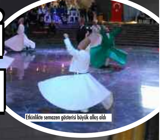
Etkinlikte semazen gösterisi büyük alkış aldı