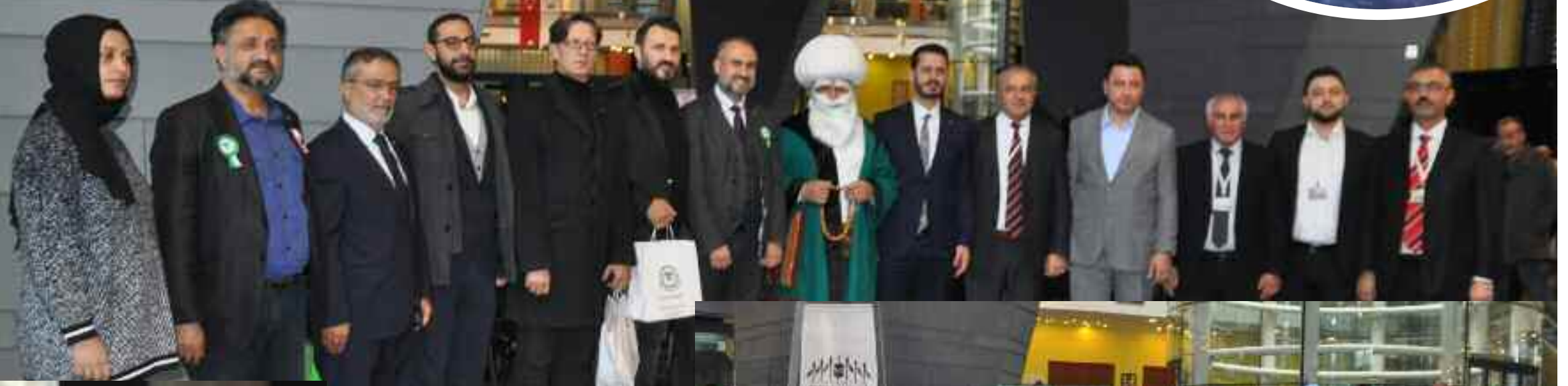
Dernek yönetimi etkinliğe katılan siyasi partilerin il başkanlarına teşekkür edip birlikte anı fotoğrafı çektiler.