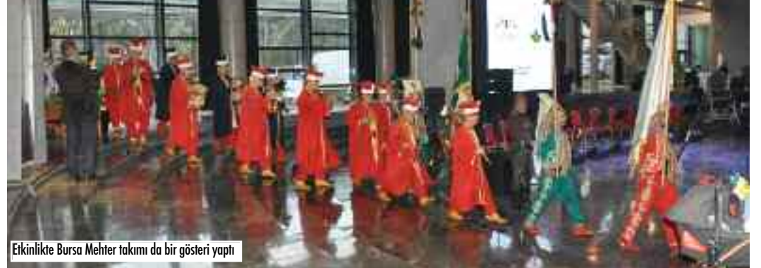
Etkinlikte Bursa Mehter takımı da bir gösteri yaptı