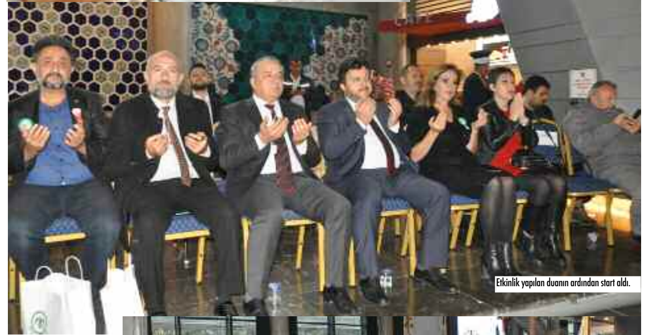
Etkinlik yapılan duanın ardından start aldı.