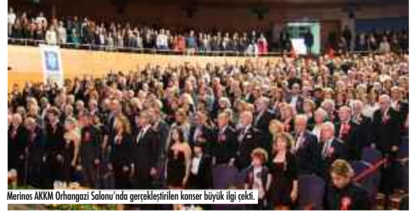
Merinos AKM Orhangazi Salonu'nda gerçekleştirilen konser büyük ilgi çekti.