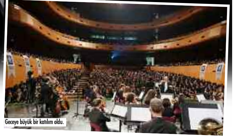
Geceye büyük bir katılım oldu.

BPLAS organizasyonunda Merinos Atatürk Kültür Merkezi'nde gerçekleşen 'Şarkılar Ataturk'ü Anlatıyor' adlı konser kalabalık davetli topluluğu tarafından izlendi. Şarkılarla Atamız unutulmadı.