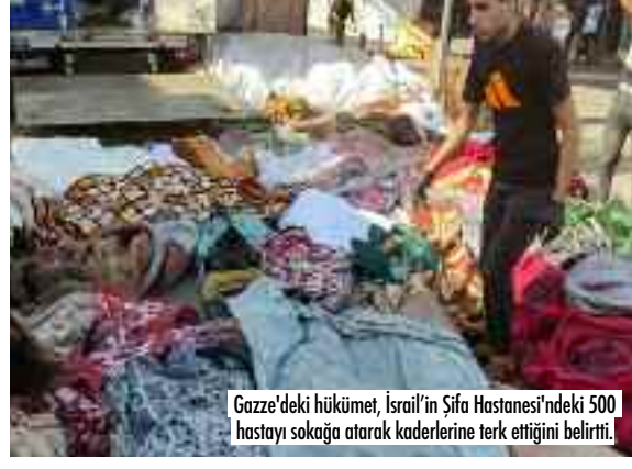
Gazze'deki hükümet, İsrail'in Şifa Hastanesi'ndeki 500 hastayı sokaka atarak kaderlerine terk ettiğini belirtti.

İsrail'in insanlık suçu işleyerek vurduğu Gazze'deki Şifa Hastanesi işlevini tamamen yitirdi.